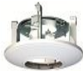
DS-1227ZJ Внутрпотолочное крепление