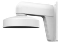
DS-1273ZJ-135 Настенный кронштейн